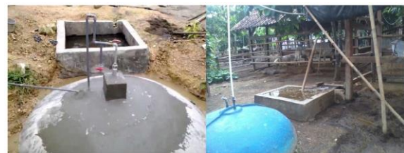
Gambar 4. Implementasi digester biogas fixed dome [36]