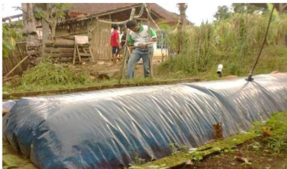
Gambar 2. Digester biogas tipe plastik tubuler [25]

Digester biogas tipe plastik tubuler (Gambar 2) menggunakan plastik PE ( polyethylene tubular ) dengan gas holder terpisah. Untuk tujuan keamanan, disarankan menggunakan dua lapisan bahan plastik dengan ketebalan masing-masing 300 mikron. Pada kedua ujungnya, plastik diikat mengelilingi pipa PVC berdiameter 6 inci dan diikat dengan tali karet. Salah satu ujung dari pipa PVC 6 inci difungsikan sebagai pintu masuk ( inlet ), sementara ujung lainnya sebagai pintu keluar ( outlet ). Di dalam digester, akan terbentuk keseimbangan hidraulik antara jumlah substrat yang ditambahkan dan digestat yang dikeluarkan. Karena sifat plastik PE yang sangat fleksibel dan rentan terhadap kerusakan, digester perlu mendapatkan perlindungan tambahan. Digester dapat ditempatkan baik dalam parit (lubang galian) maupun bak berbentuk memanjang. Perlindungan sinar UV matahari diperlukan untuk melindungi plastik. Dari aspek teknis dan biaya, digester plastik tubuler dianggap sebagai opsi paling sederhana dan ekonomis [34]. Kelebihan digester adalah standar biaya yang rendah sebelum pemasangan, cocok untuk wilayah dengan tingkat air permukaan yang rendah karena dapat diinstal dengan dangkal, proses transportasi yang mudah, konstruksinya tidak memerlukan keahlian khusus, suhu digester cenderung tinggi di daerah beriklim hangat, proses pembersihan relatif sederhana, digester dapat beroperasi efektif dengan substrat yang sulit, pengurasan dan perawatan mudah dilakukan [35].